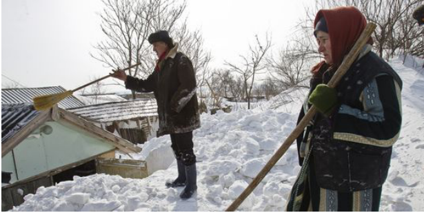
Un couple de paysans roumains tente de dégager sa maison prise dans la neige, le 10 février.

Texte n°1 : Le bilan du froid s'alourdit avec plus de 600 victimes en Europe.